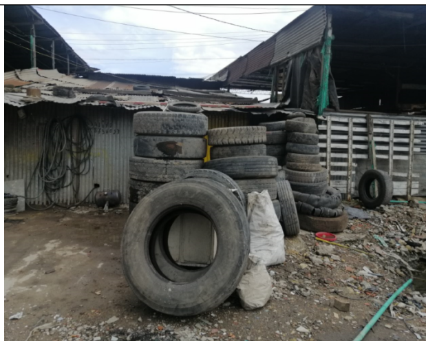
Foto 2. Vista general del Acopio de llantas.