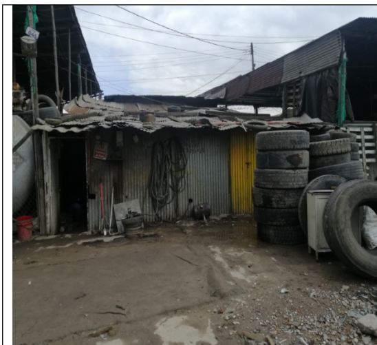
Foto 1. Vista general del establecimiento.

SDA 2018EE122215 , evidenciando que el establecimiento no ha cumplido con lo solicitado en el requerimiento mencionado en el presente párrafo CON RESPECTO A: no se encuentra registrado como acopiador de llantas ante la Secretaría Distrital de Ambiente –SDA , no realiza el reporte mensual de las llantas acopiadas, compradas y/o aprovechadas en el aplicativo WEB de la SDA, no cumple con las garantías de almacenamiento cubierto y no cuenta con un plan de contingencia para emergencias del establecimiento.